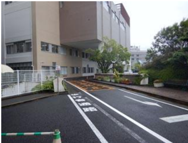
②建物手前を通り奥に進む