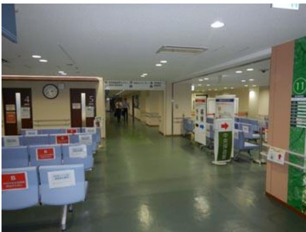
③突き当りを左へ進む