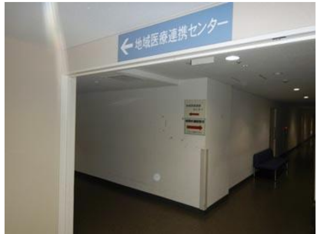
④一つの角を左へ進む