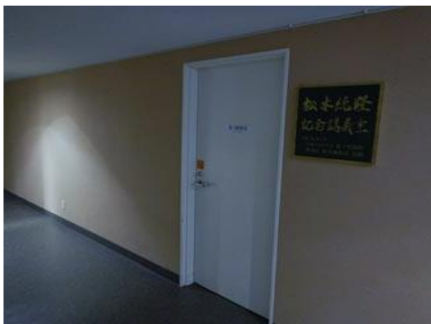
⑤左手に会場入り口