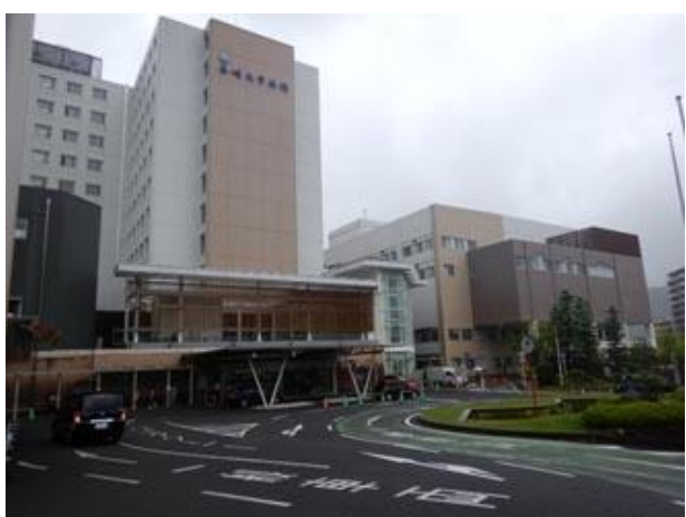
①大学病院正面の右側へ進む